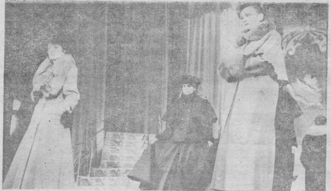
Театр оперетты Кузбасса и Дом моделей совместно придумали и показали театрализованное представление «Театр, мода и я». Творческое содружество театра оперетты с Домом моделей будет продолжено.