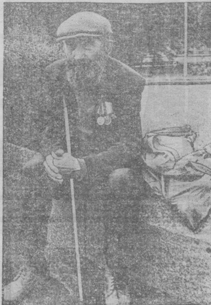
Нас все меньше и меньше.