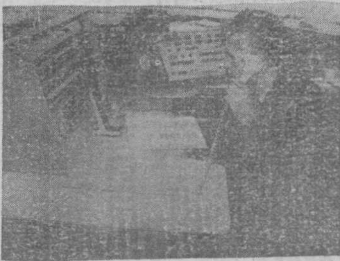
Дежурная часть. За пультом связи. Сюда поступают сигналы беды от кемеровчан.