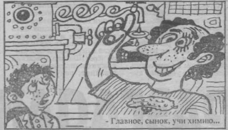
- Главное, сынок, учи химию...