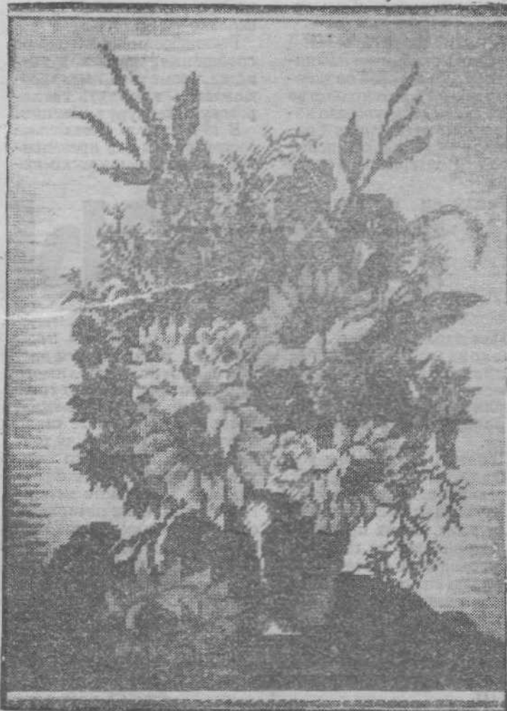
• Люди нашего города