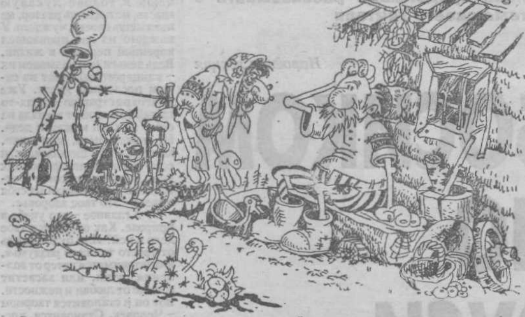
- Внучка из реанимации звонила, говорит, в той репке нитраты какие-то нашли!

Два года назад, на ноябрьские праздники, двое кемеровских туристов устроили себе «маршрут выходного дня» — решили парни «отметиться» в верховьях Томи. Оба опытные, прошедшие не один пешеходный, горный и водный маршрут, в том числе и самых высоких категорий сложности — «шестерок». Взяли с собой лыжи и прочее снаряжение, зарегистрировали маршрут в городском клубе туристов, договорились о контрольных сроках.