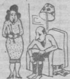
«Я не стала врать стопу. Ты все равно развешь носки на мою талию...»

18.15 Детектив по понедельникам. «Кукарача». Худ. фильм. 19.45 Праздник каждый день. 20.00 Док. фильм. 20.25 Телеканал «Фортуна». 21.50 Спортивная карусель. 21.55 Репортер. 22.05-23.00 Телеканал «Фортуна». Продолжение.