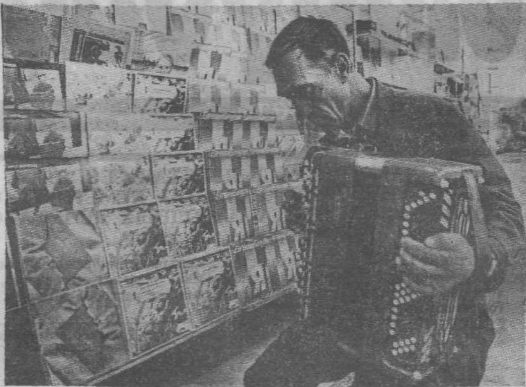
В секции музыкальных товаров появились новые баяны. Их придирчиво изучает очередной покупатель. Не зря, ведь, говорят: не хлебом единым жив человек...

Да, много интересных новинок рождается в "Торговом доме".