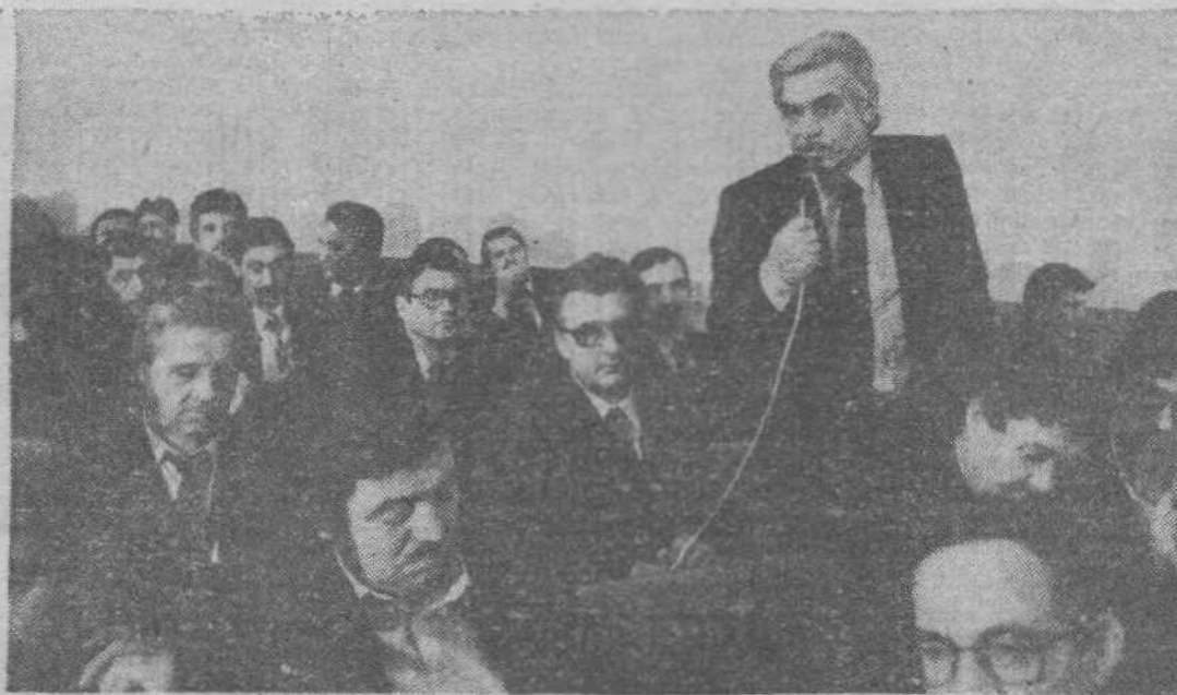
• После сессии

А если поинтересоваться на Крапивинский гидроузел... стр. 4.