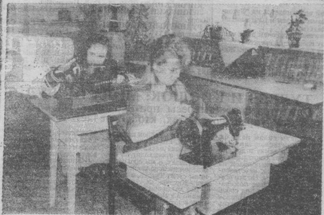
На снимке: юные швеи из кружка "Волшебная иголка" Рудничного дома творчества (бывш. Дома пионеров) "колдуют" над пошивом детской одежды.