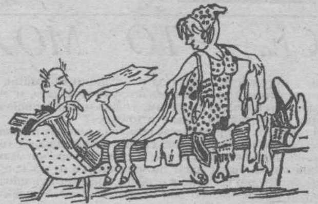
Жена: - Хотя какая-то польза от тебя в выходной день