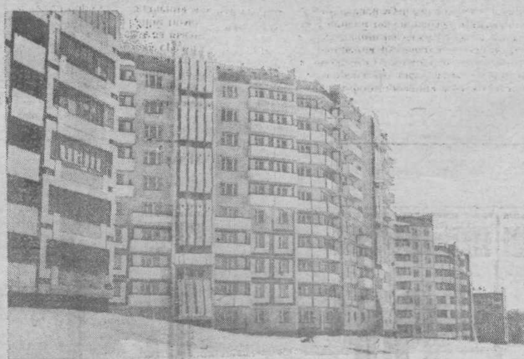
Один из новых домов в 21-м микрорайоне Кировского. Здесь совсем недавно был пустырь. А теперь высотные дома стоят, плотно прижавшись друг к другу. Вот деревьев маловато, а цветов летом почти не видно.

Ответ на этот вопрос вы найдете на стр. 4.