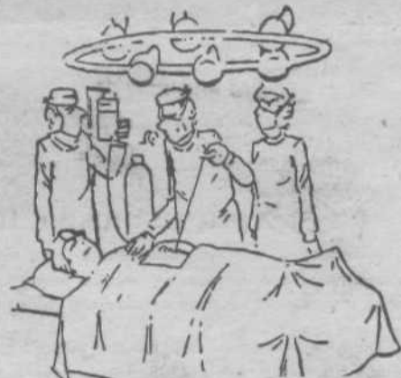
Сто двадцать рублей... Сто сорок... Двести... Двести пятьдесят рублей... Кто больше?

в течение суток атмосферные условия нарушают крепкий сон людей с повышенной нервной чувствительностью и неустойчивостью нервной