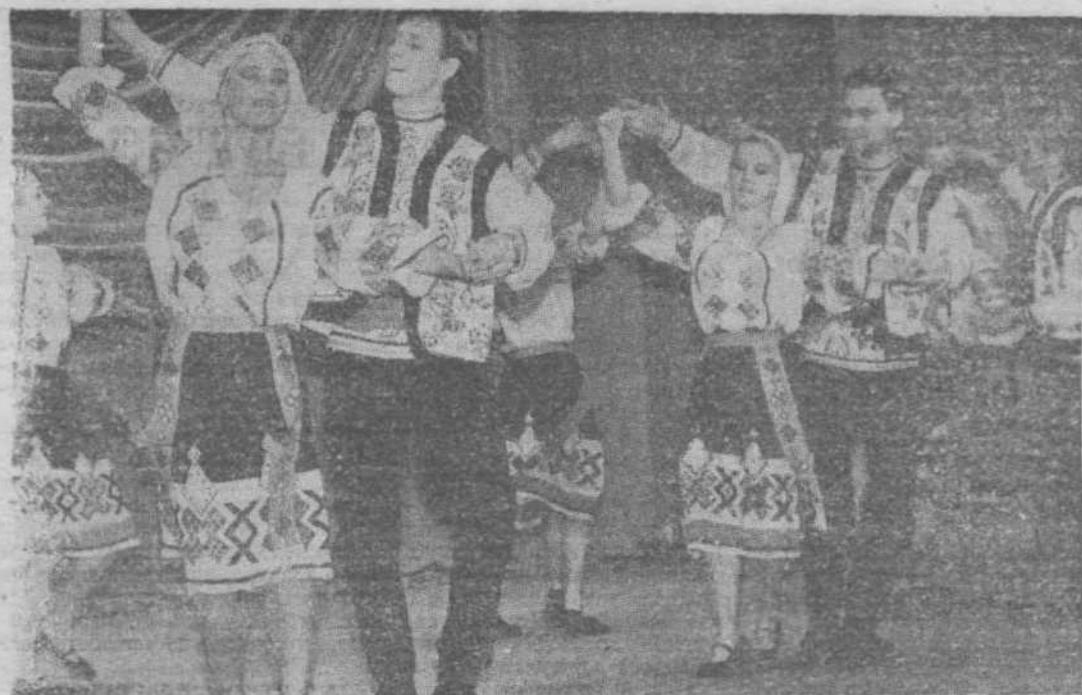
НА СНИМКЕ: выступает танцевальный ансамбль "Сибирь".