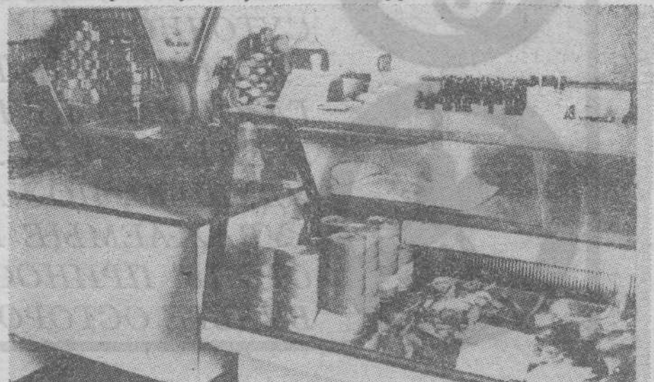
Цены кусаются...