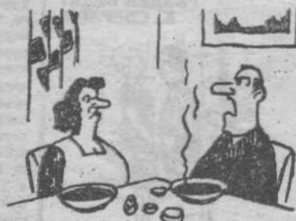
- А что это за суп? Я должен знать, если мне придется обратиться к врачу.