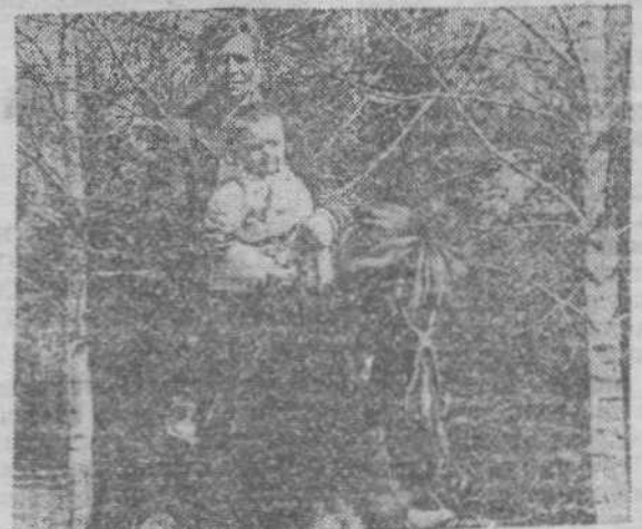
На снимке: в районе кинотеатра "Антошка" начало работать малое предприятие "Алюр". Все желающие могут на несколько минут стать джигитами или прокатить своих детей на настоящем скакуне.

В. КЛЮНК, ст. инспектор ГАИ УВД Кемерово.