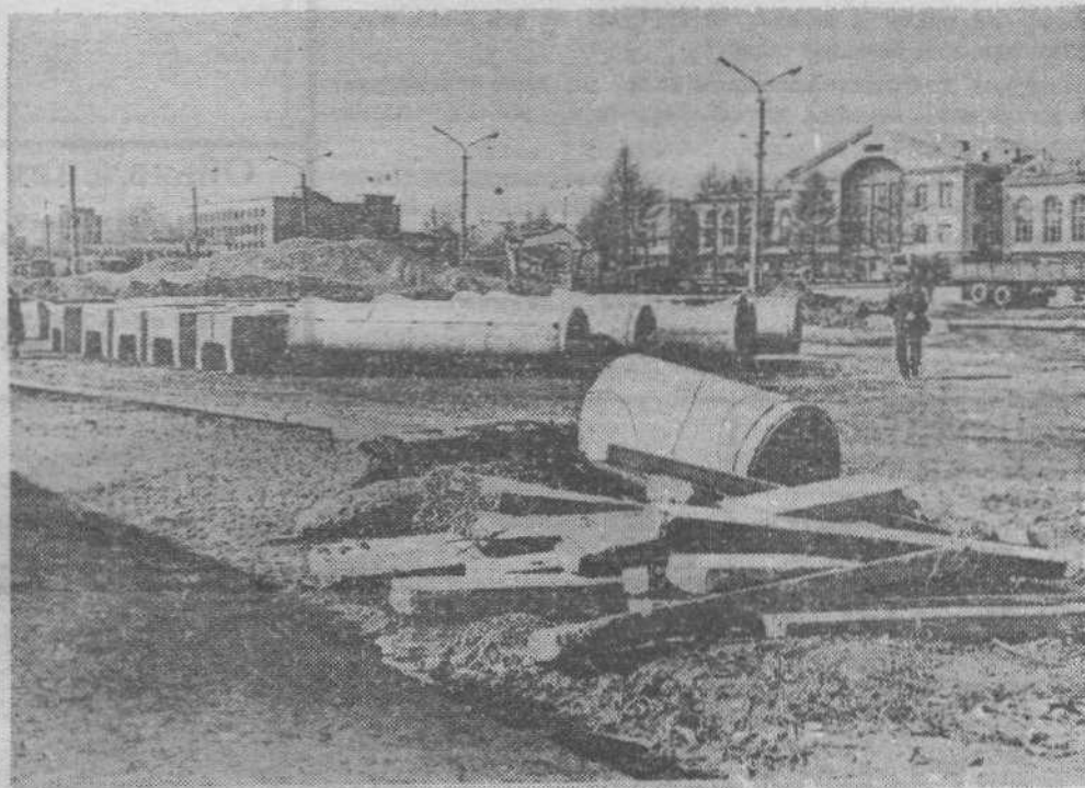
Как прекрасен этот мир, посмотри... Кузнецкий проспект.

...Сотрудникам мединститута предложили яблочное повидло. За банку - 40 рублей. Через два дня объявили, чтобы к 40 рз мы добавили еще по двадцатке. Пока ждем эти вожделенные банки, цена неуклонно растет. Кроме это-