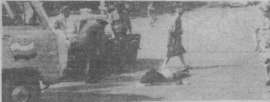
Дорожно — транспортное происшествие.

Мы примерно догадываемся, отчего происходят эти неуязвочки. Разные автопредприя-