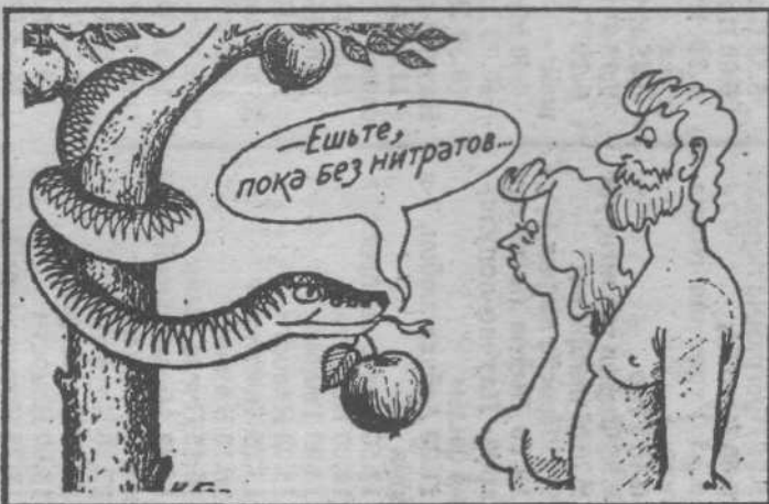
• Горожанин, бди!

ОТ РЕДАКЦИИ. В середине мая совет администрации города рассмотрел вопрос о состоянии заболееваемости кемеровчан острыми