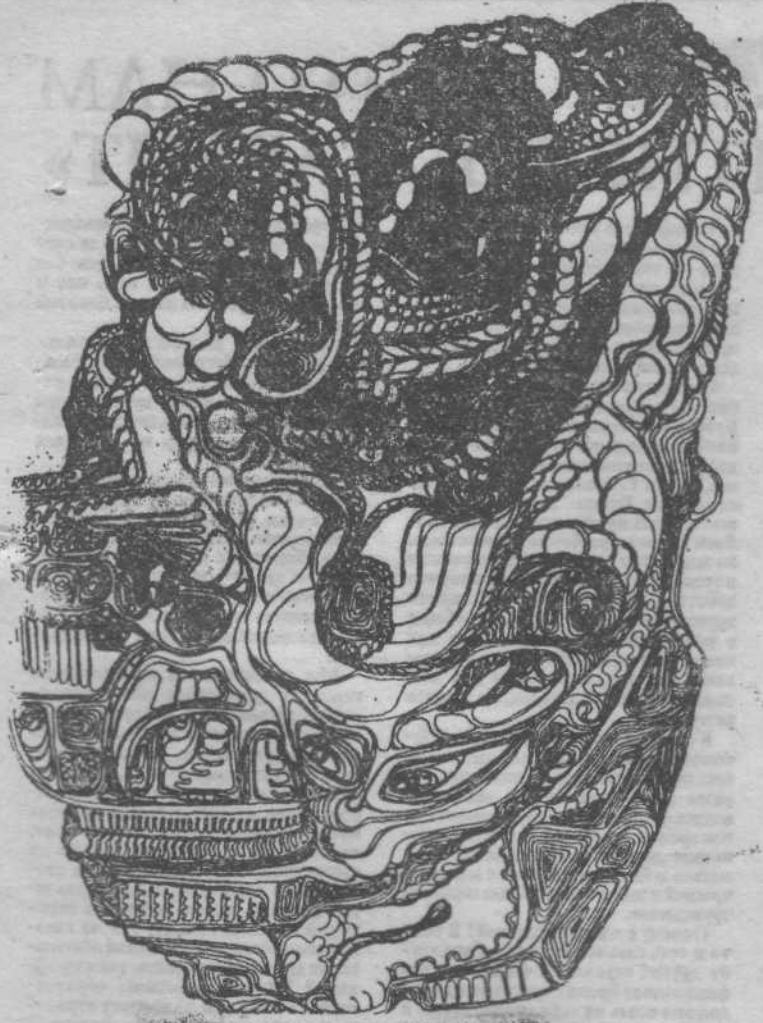
(Оконч. Нач. на 1-й стр.)

роятно! На днях в кемеровском издательстве «Практика» вышла книга стихов и прозы Вячеслава Лопушного, иллюстрированная работами Татьяны Григорьевой. Это еще одно свидетельство ее признания на родине.