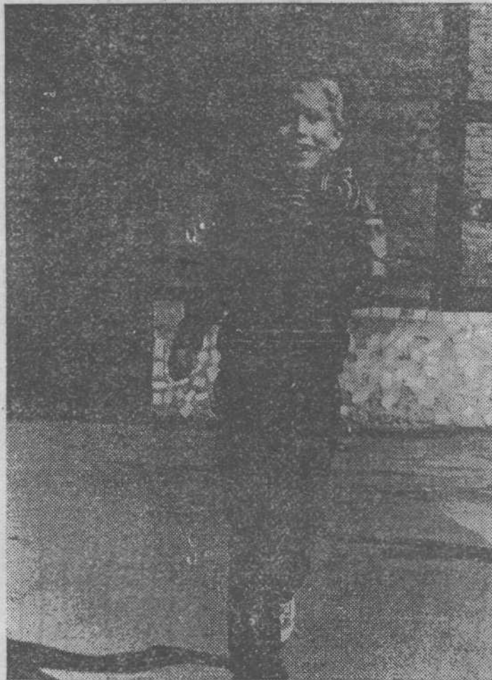
Первый раз - в первый класс.