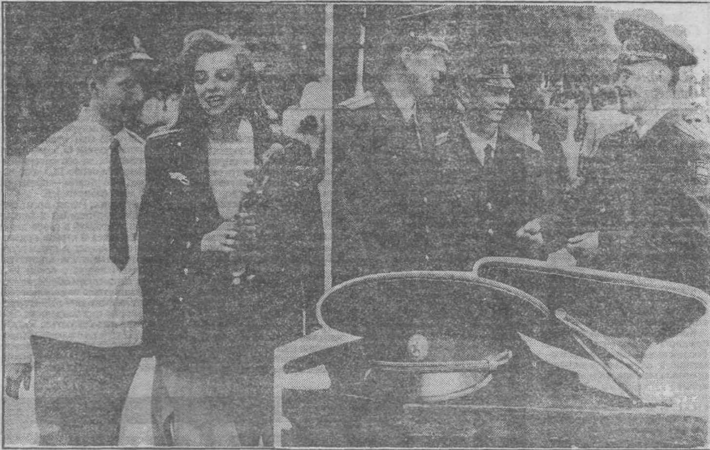
В минувшую субботу около 200 молодых офицеров, выпускников Кемеровского высшего военного командного училища связи, пополнили ряды Российской армии. Ребята сами выбрали себе нелегкую судьбу. Безоблачное небо — это для нас, для генеральских погон вам, ребята!