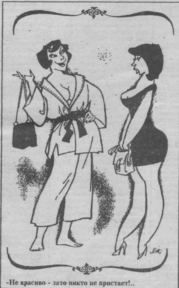
-Не красиво - зато никто не пристаёт!..

В уголовном розыске работают асы, но даже они подрастерялись. Подобных событий в своей практике никто не помнил. Самые опытные провели аналогию, несколько, правда, странную для нас, непосвященных: год назад у самолета «Антошка» была