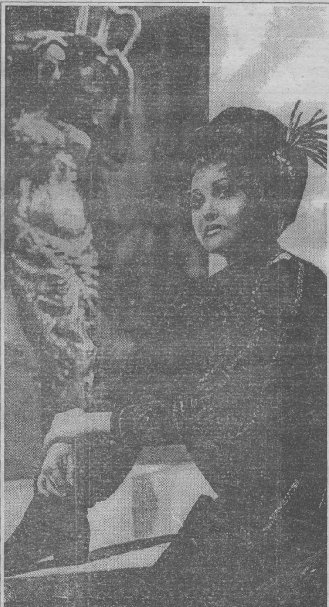
Сегодня открывается III областной фестиваль «Кузбасс театралный». На снимке — заслуженная артистка России Нина ЧЕРНОУСОВА в роли Дон Жуана из спектакля театра оперетты Кузбасса «Дон Жуан в Севилье». Читайте интервью с артисткой на странице 6.