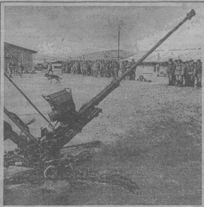
Из афганского дневника