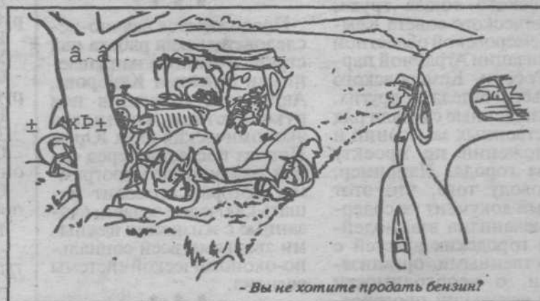
- Вы не хотите продать бензин?

Тем не менее специалисты подчеркивают, что сонливость побороть невозможно. Если веки становятся свинцовыми, вы начинаете моргать и не можете сдержать зевоту, остается только одно - поскорее остановиться и отдохнуть.