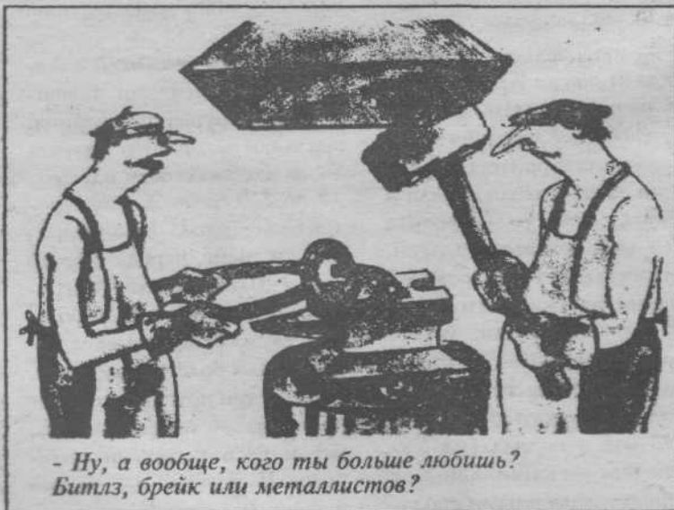
— Ну, а вообще, кого ты больше любишь? Битлз, брейк или металлистов?