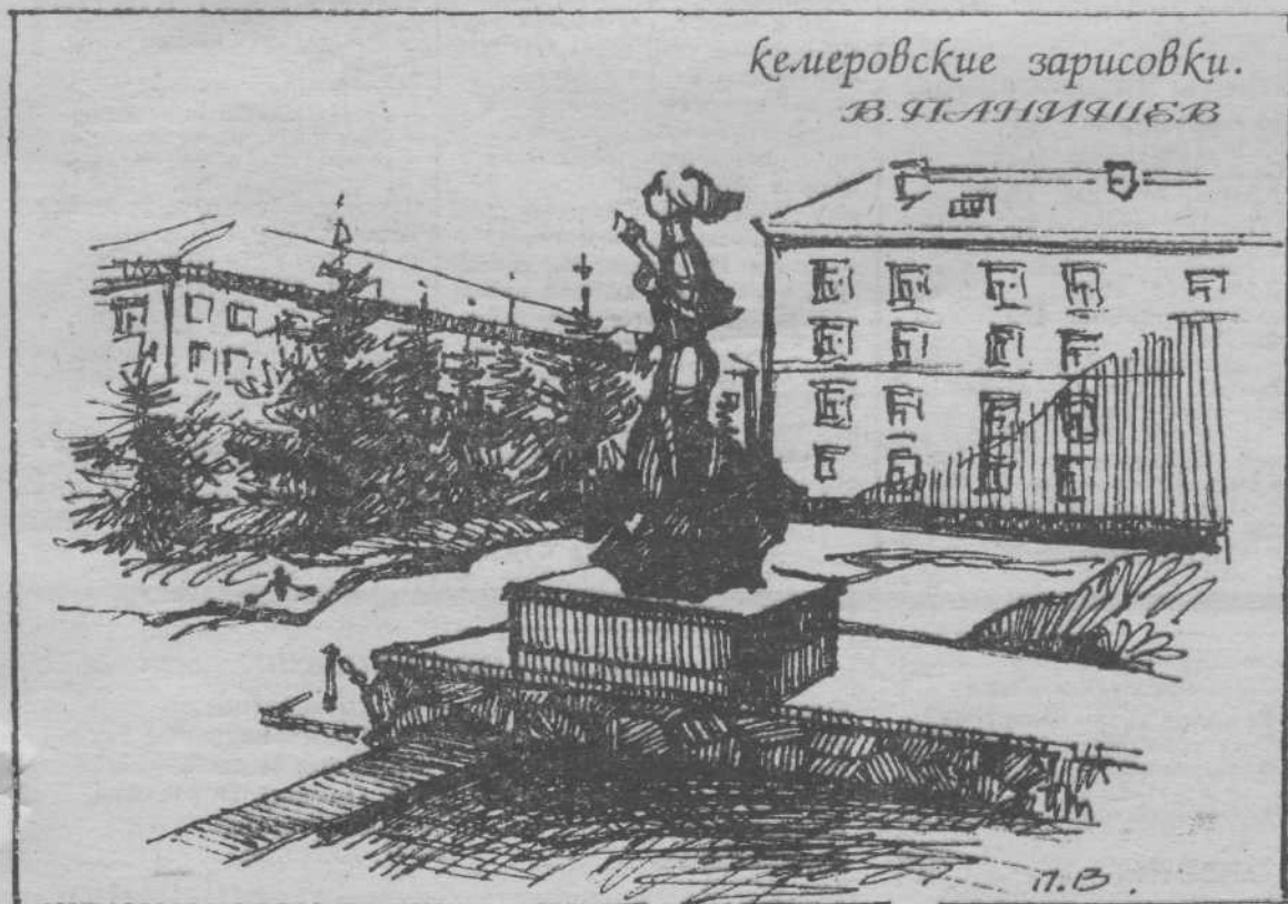
Кемеровские зарисовки. В. ПЛАНИЧЕВ