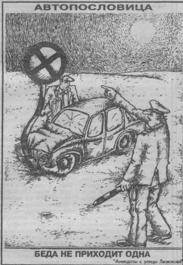
БЕДА НЕ ПРИХОДИТ ОДНА

Григорий ШАЛАКИН, корр. ИТАР-ТАСС - для "Автостопа".