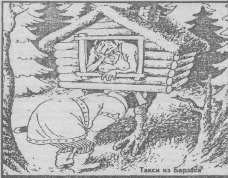
Такси из Барзаса