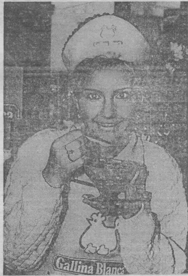
Добрые старые традиции возрождает Кемеровский ЦУМ - в минувшую пятницу горожан пригласили уже на вторую дегустацию продуктов. В этот раз все любопытные могли попробовать супы, соусы, гарниры испанской фирмы "Gallina Blanca".

Л.АРТАМОНОВА. (Пресс-служба городского УВД).