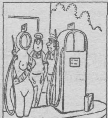
- Ты в самом деле уверен, что с новой колонкой дела у нас пойдут лучше?