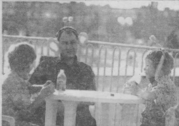
За столиком на площади и еда вкуснее, чем дома.

К вечеру веселье достигло апогея. Началась долгожданная дискотека. Молодежи собралось столько, что, казалось, на площади для всех мало места. Оглушительно гремела музыка. Проспект