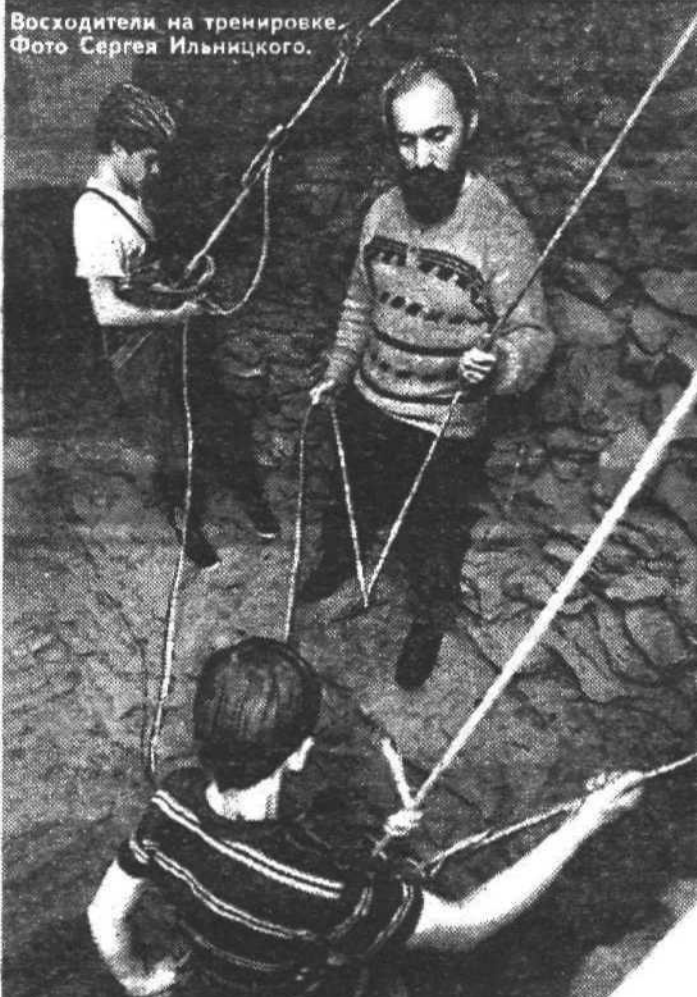
Восходители на тренировке.

Есть у "Восходителя" и изюминка - своя собственная гора и не где-нибудь за городом, а прямо под крышей клуба. Владимир Анатольевич долго вынашивал эту фантастическую идею, но в конце концов превратил ее в реальность. И вот уже несколько лет ребята отрабатывают навыки скалолазания, не выходя из стен клуба на своей шестиметровой горе. На языке альпинистов, на скалодроме. Таких тренажеров у клубов подобного ранга в России единицы. Многие кемеровчане не раз видели юных смельчаков, поднимающихся по отвесным скалам правого берега Томи в районе Журавлей по всем правилам альпинизма. Это либо младшие воспитанники "Восходителя", либо вылетевшие из гнезда "птены" Владимира Анатольевича, навсегда влюбленные в горы. Повзрослевшие, они приходят сюда в свободное время сами и приводят своих детей.