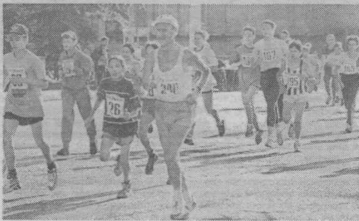
Б. ПРОСКУРИН.

Под звуки торжественного марша ключи от легкового автомобиля были вручены победителю в беге на марафонскую дистанцию Сергею Колесникову. Не остались без внимания и остальные призеры. Всем участникам марафона вручены памятные значки, дипломы.