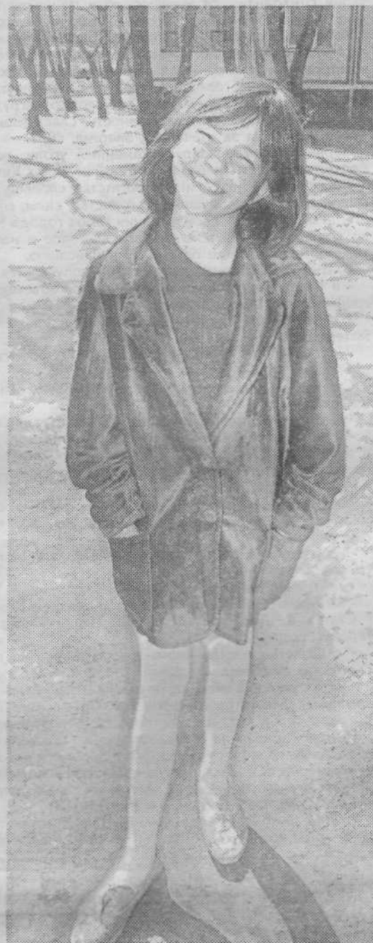
Жаль лето прошло. Зато веснушки остались.