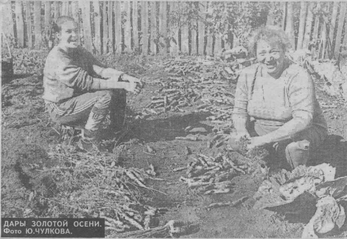
ДАРЫ ЗОЛОТОЙ ОСЕНИ.