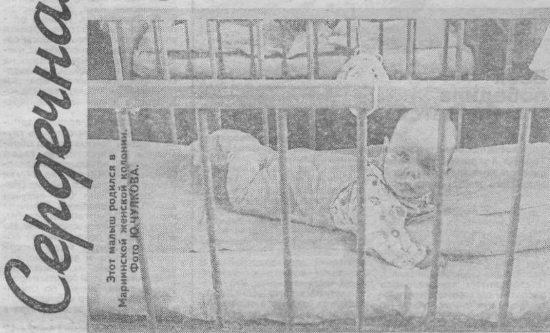
Этот малыш родился в Мариинской женской колонии.

рот, 30 процентов которых после выхода из детдома становятся бомжами, 20 - преступниками, 10 - сводят счеты с жизнью.