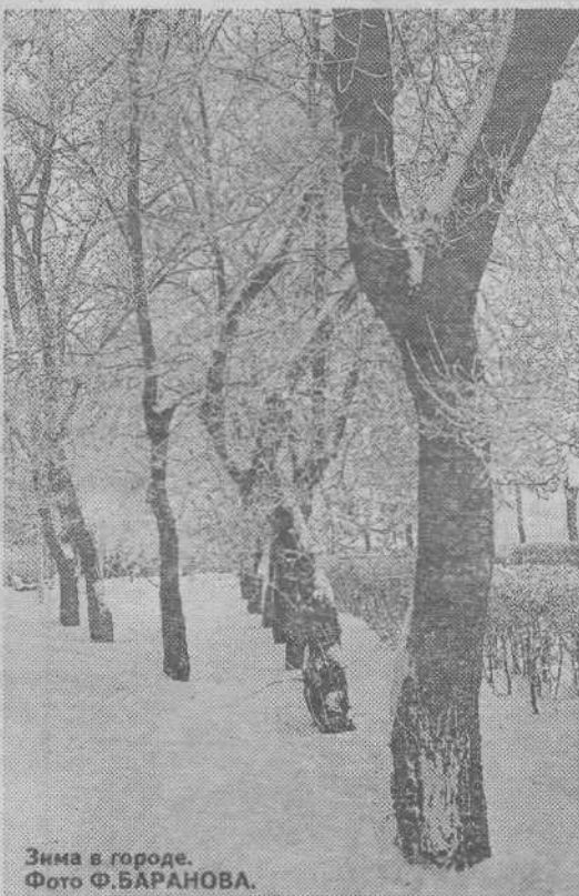
Зима в городе.