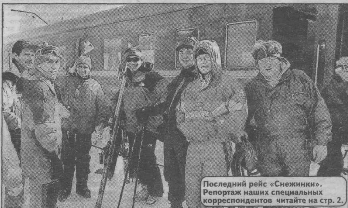
Последний рейс «Снежинки». Репортаж наших специальных корреспондентов читайте на стр. 2.