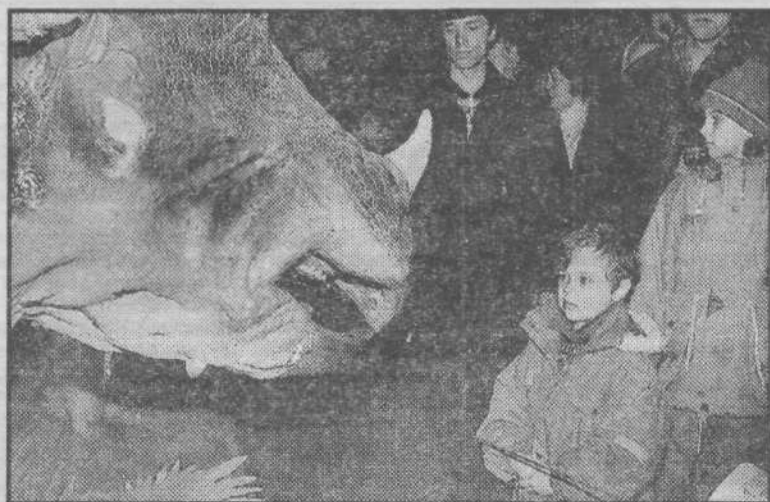
Дети и взрослые, желающие попасть в это воскресенье на выставку динозавров, с утра толпились у входа в областной краеведческий музей.

Не всем ребятишкам хватает смелости шагнуть в загадочный доисторический мир. Из каждого угла полутемного зала глядят огромные зубастые морды с горящими глазами. Шевелятся, как живые, чудовища — пришельцы из древней эпохи. У-у-у-у! — храбро кричит ребенок, подойдя к динозавру ростом под потолок. Чудовище отвечает протяжным жутким ревом, и малыши с округлившимися глазенками прижимаются к своим мамам. Не каждый ре-