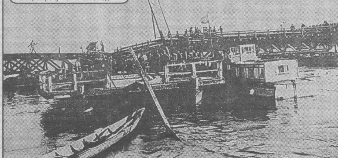
Из фондов Государственного архива Кемеровской области. Строительство понтонного моста через реку Томь. 1935 год.