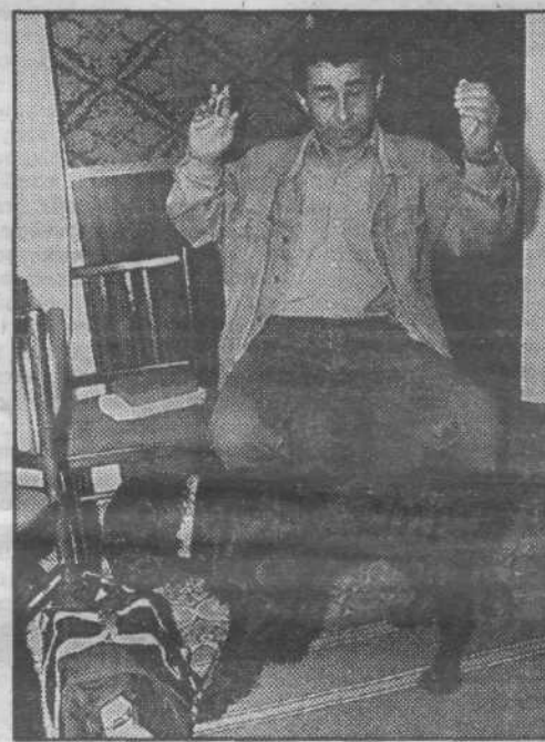
Жизнь служебной собаки, по сравнению

За каждой из этих цифр стоят конкретные специалисты-кинологи и их питомцы, среди которых имеются и свои чемпионы. Так, на прошедших четырехмесячных сборах в известной ростовской школе служебного собаководства пес по кличке Николь из вневедомственной охраны г. Юрга получил наилучшие оценки своего мастера, особо отличившись в поиске взрывчатых веществ и оружия. После этой победы и всеобщего признания о Николь в управлении вневедомственной охраны даже сняли фильм, а занимающегося с ним милиционера поощрили материально. К слову сказать, стоимость собаки с уровнем подготовки, как у Николь, доходит до 10 тысяч рублей. Есть в собачьей батальоне и другие отличники службы, которыми гордятся воспитатели.