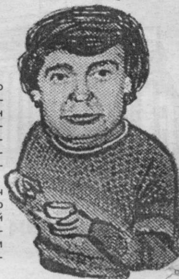
Друж. шарж О. Аксенова.