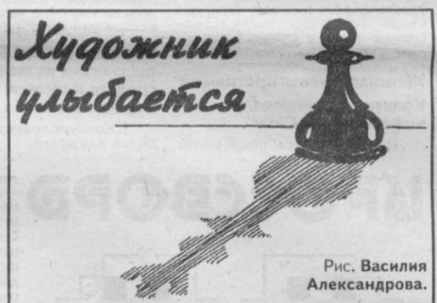
Рис. Василия Александрова.

Товарищеская игра по футболу. 26.06.99 г. в 12-00 час., ст. «Факел» п. Промышленновский.