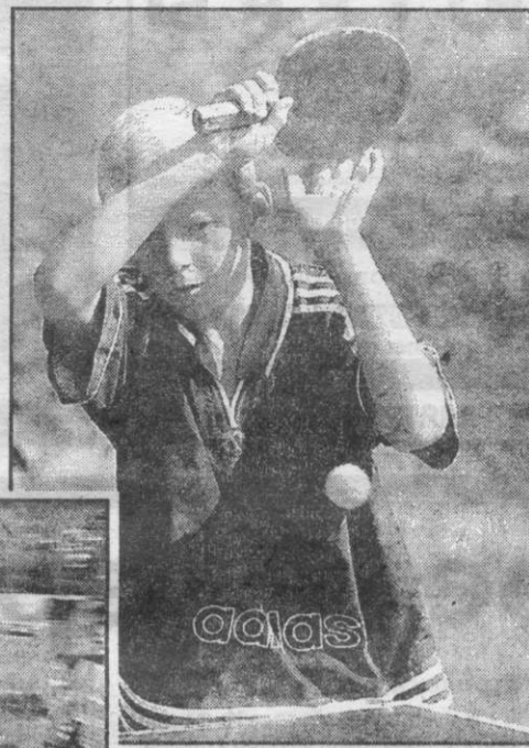
На снимках фотокорреспондента Сергея Ильинского фрагменты спортивного праздника, прошедшего в областном центре в минувшие выходные.