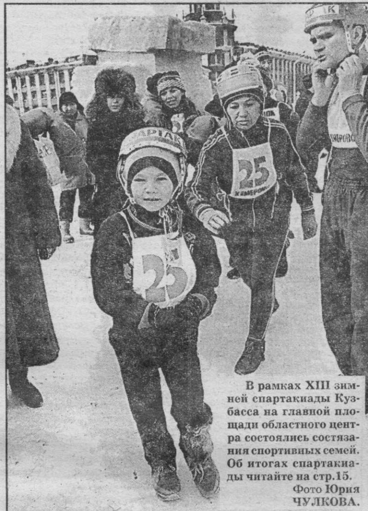
В рамках XIII зимней спартакиады Кузбасса на главной площади областного центра состоялась состязания спортивных семей. Об итогах спартакиады читайте на стр.15.