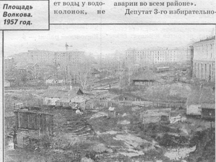
Площадь Волкова. 1957 год.