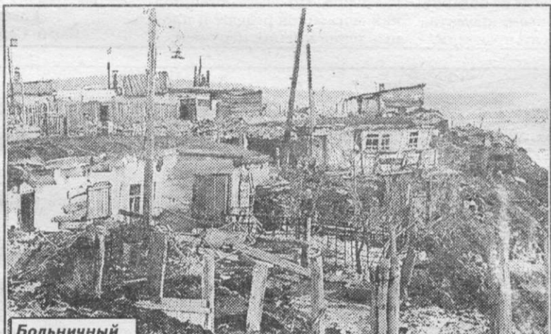
Больничный лог (горсад). 1935 год.