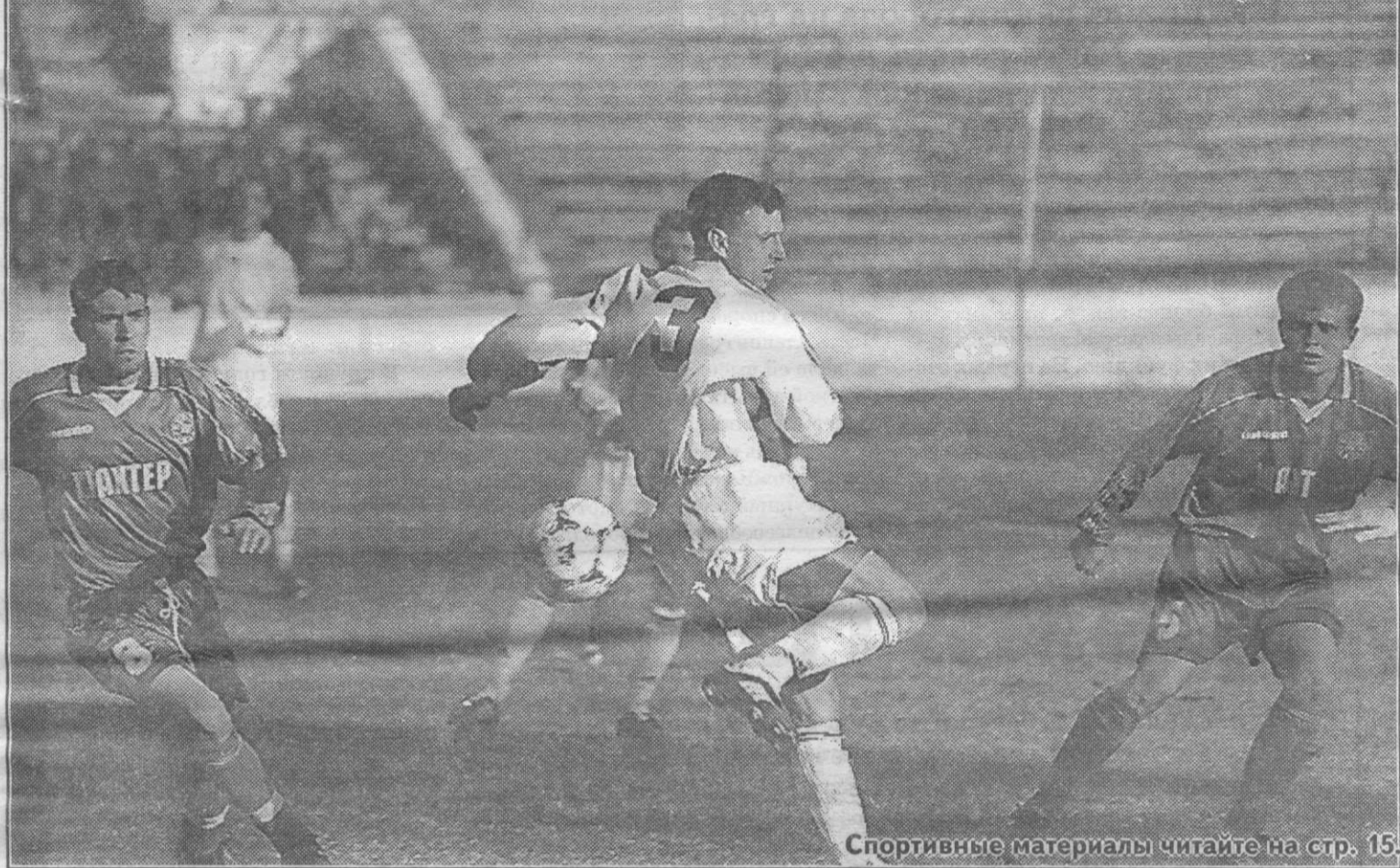
Спортивные материалы читайте на стр. 15.