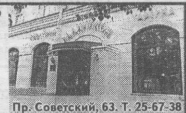
Пр. Советский, 63. Т. 25-67-38