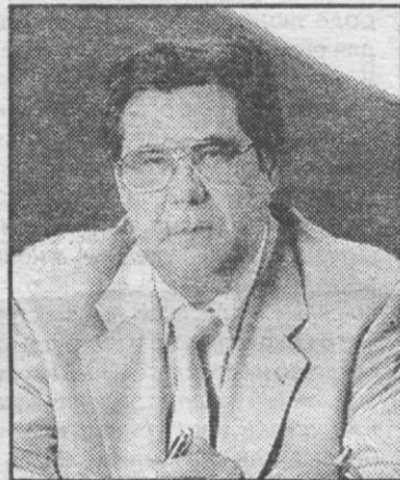
Аман Тулеев, губернатор Кемеровской области.

«не нашлось места врачам, инженерам, студентам, журналистам. Пятнадцать лет назад правые последовательно высмеяли злополучный лозунг «Каждая кухарка должна уметь управлять государством», и правильно сделали. Кухарка должна уметь готовить. Но высмеять-то высмеяли, а руководством к действию сделали. И предвыборным козырем — тоже.