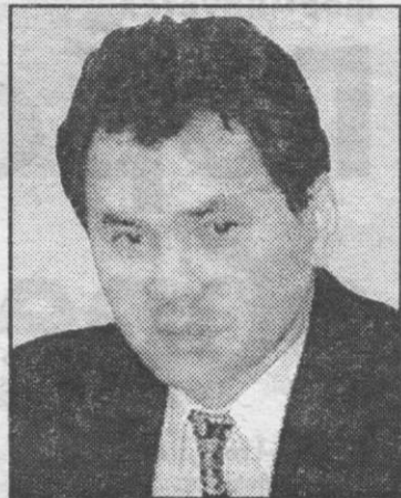
Сергей Шойгу, министр ЧС.

да принимали множество. И были среди них такие, что чуть было не погубили нас всех (а некоторых из нас погубили). Не все, кто голосовал за их принятие, были недобросовестными людьми, некровными лоббистами. Часто «за» голосовали честные непрофессионалы, романтики-идеалисты. Американцы до сих пор с удовольствием цитируют некоторые старые законы, сгорая придуманные и принятые малограмотными трапперами. Мы пока цитируем плоды постперестроечного законодательства с горечью и возмущением. Придет время — посмеемся.