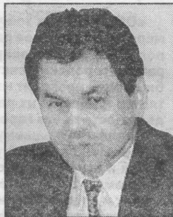
Сергей Шойгу, министр ЧС.

вающий в месяц меньше бюджетника. Владелец киоска или изготовитель пирожков. До дефолта эти люди жили более или менее прилично, сегодня едва сводят концы с концами и мучаются, пытаются сориентироваться: то ли бросить все и поискать работу в бюджетной организации, то ли подождать лучших времен. В предвыборной программе «ЕР» поддержка среднего и малого предпринимательства идет отдельным пунктом.