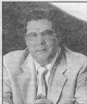
Аман Тулеев, губернатор Кемеровской области.

татка человек и в очереди стоять поленился, прожиточный минимум, увы, кажется хорошей цифрой. На это можно прожить. Это несколько дополнительных лет жизни. Старики хотят жить. Даже питаются хлебом и крупой и забывают о покупке нужных лекарств, они мечтают дождаться рождения правнуков.