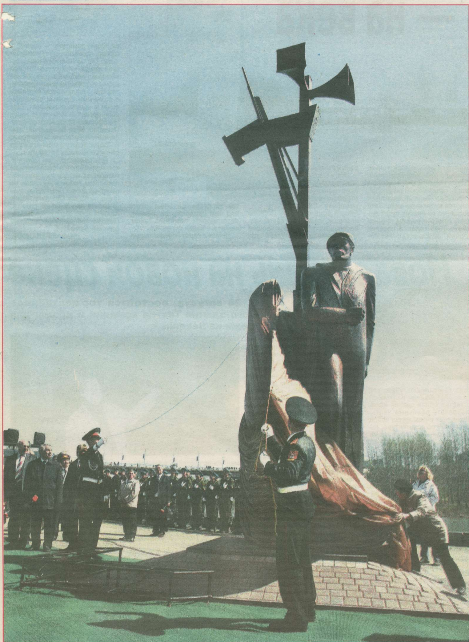
Торжественное открытие в парке Победы 9 Мая первого в городе памятника, посвященного труженикам тыла.

На кровле дома № 13 по ул. Космическая заменено почти полторы тысячи квадратных метров шифера, сделаны новые слуховые окна, на чердачные перекрытия уложен слой утеплителя. Капитально реконструирована и кровля дома по ул. У. Громовой, 11. Продолжается капитальный ремонт кровель домов по Весенней, 15, Халтурина, 27, пр. Советский, 36. Отремонтирована система отопления в домах по ул. Александрова, 16, б-р Строителей, 32 «а», ул. Весенняя, 15, Тухачевского, 45 «б». Приведены в порядок фасады зданий по ул. Дзержинского, 3 и 5. В конце апреля в работе находились около двух десятков фасадов. Среди них дома № 24, 31, 34, 36, 39, 42, 55, 67 по пр. Советский. Отремонтированы 11 балконов в Центральном районе. Вместе с жителями по схеме 50x50 отремонтированы 33 подъезда домов по ул. Ворошилова, Тухачевского, 45 «б» и др.