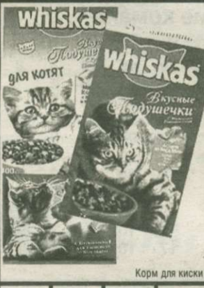
Корм для киски