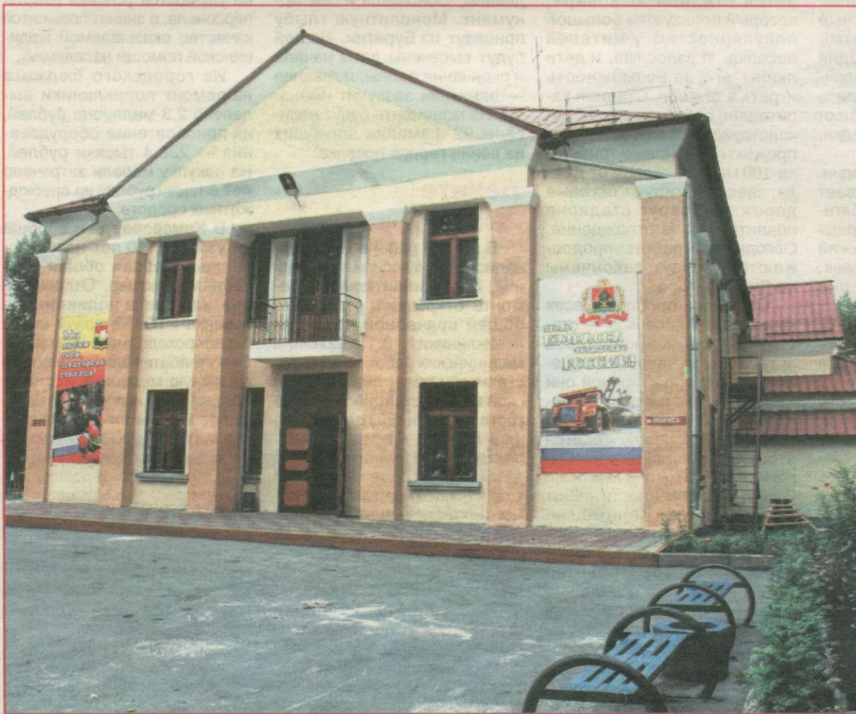
На снимках: в поликлинике РТС; клуб в Пионере.