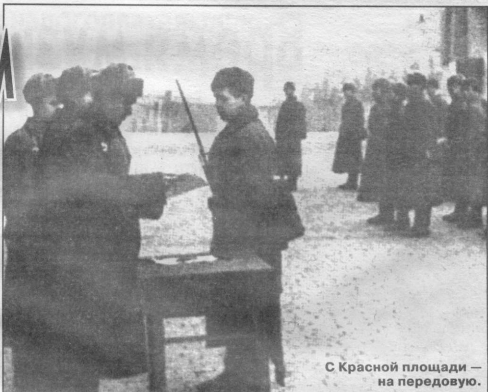
С Красной площади — на передовую.

Когда стало совсем светло, появилась зеленая ракета — открыл огонь по немецким танкам. После первого залпа начали рваться бензовозы, обдавая пламенем танки и машины, которые тоже начали рваться и гореть. По окончании